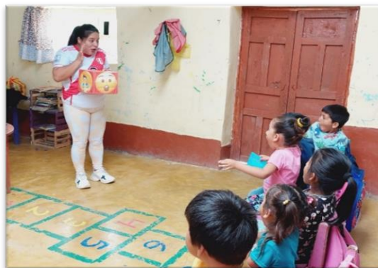
Ilustración 7: niños de la IE N° 17771 la docente explicando el juego.