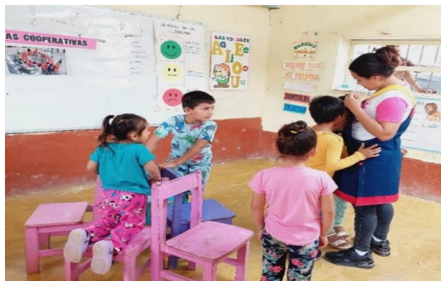
Ilustración 1: Niño de la IE N° 17771 está llorando