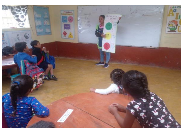
Ilustración 8: niños de la IE N° 17771 están concentrados escuchando a la maestra.