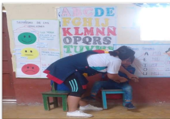
Ilustración 7: Niños de la IE N° 17771 Franco está muy enojado agrediendo a la docente.