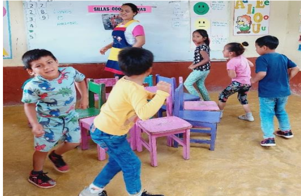
Ilustración 6: Niños de la IE N° 17771 están jugando a las sillas cooperativas.