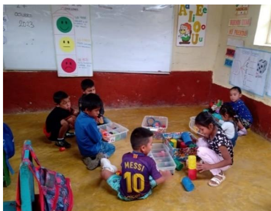
Ilustración 13 niños de la IE N° 17771 jugando con los bloques.