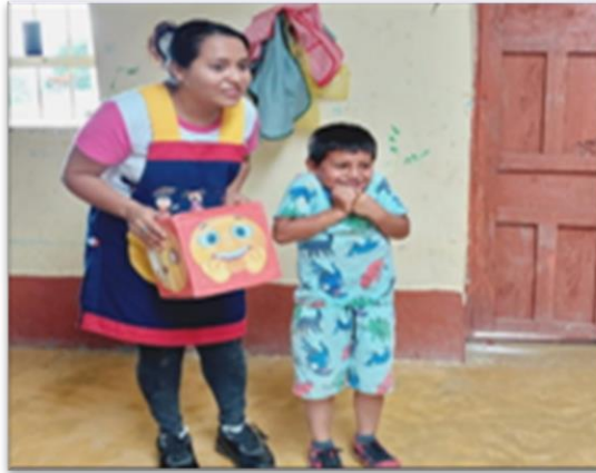
Ilustración 7: niños de la IE N° 17771 imitando una emoción.