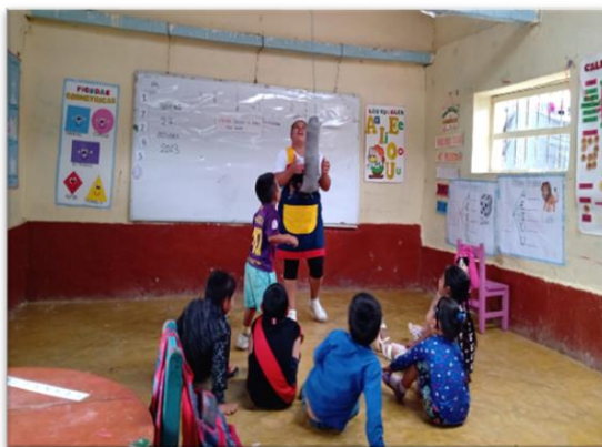
Ilustración 9: niños de la IE N° 17771 están concentrados a la explicación de la docente