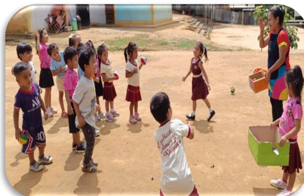
Figura 2 “Dinámica con pelotas”

Nota: niños y niñas de la I.E.I 495, participando de la dinámica “me divierto insertando pelotas en las cajas de colores”