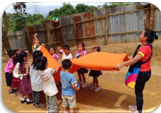
Figura 3 “Dinámica con pelotas”

Nota: niños y niñas de la I.E. I 495, participando de la dinámica “me divierto sosteniendo las pelotas con la manta sensorial”