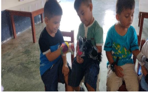
Desarrollo de actividades con títeres de mano.