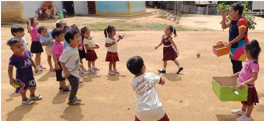
Actividad: “Me divierto insertando pelotas de colores en las cajas de colores”