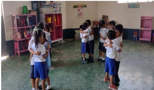
Dinámicas grupales “El barco se hunde”