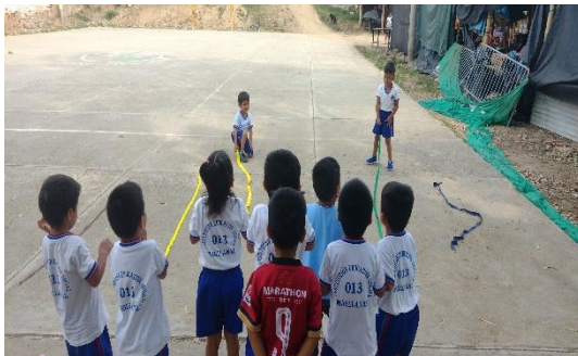
Actividad “Jugamos con las cintas de colores”