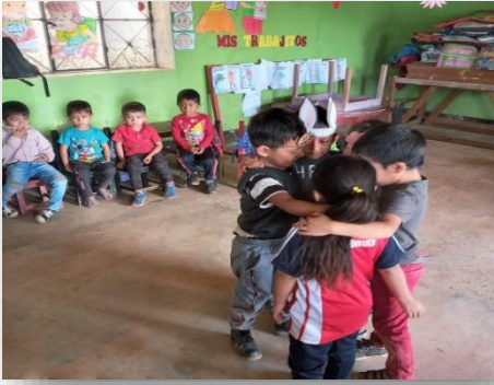
Cuento con títeres de mano “buen trato”