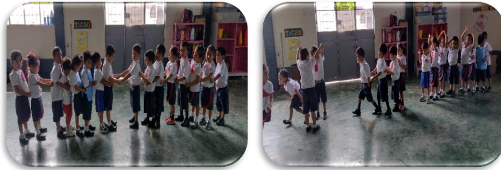
Nota: niños y niñas participando de la dinámica “Jugamos a las fuerzas”