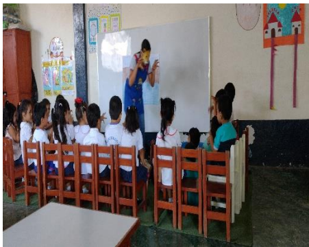
Representación con máscaras.