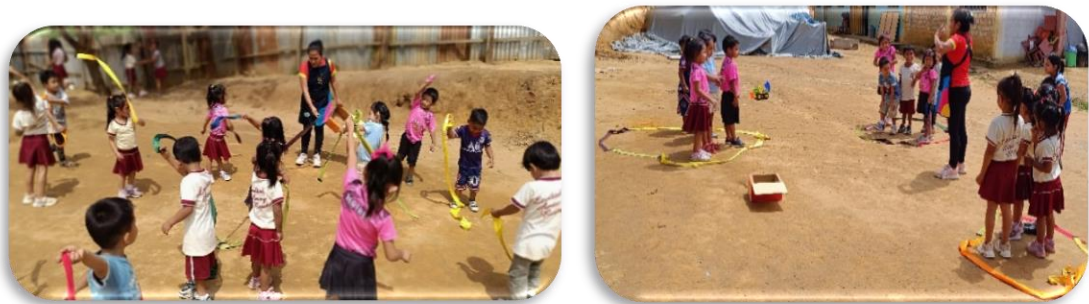
Nota: niños y niñas de la IEI 495 participando de la dinámica “realizamos casitas de colores usando cintas y sogas”