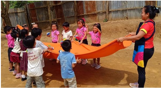
Actividad: “Me divierto sosteniendo las pelotas con la manta sensorial”