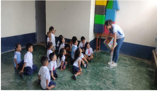
Actividad: “Me divierto insertando pelotas”