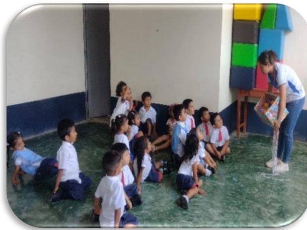
Figura 1 “Dinámica con pelotas”

Nota: niños y niñas de la I.E. 013- Magllanal, participando de la dinámica con “pelotas”.