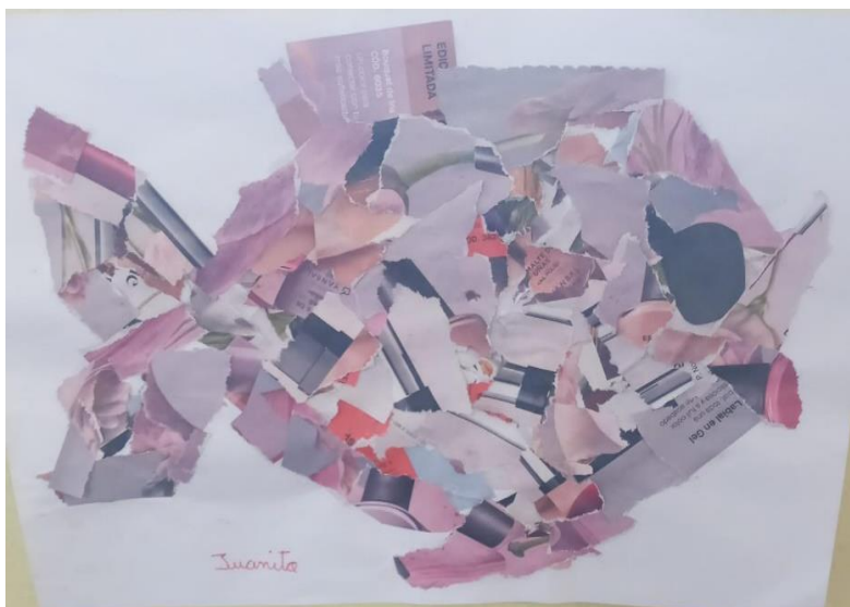
Collage con material reciclado