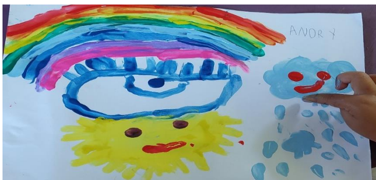
Técnica dactilopintura con témperas

Nota: el niño realizó un sol, un ojo, un arcoíris y una nube con unas gotas de agua