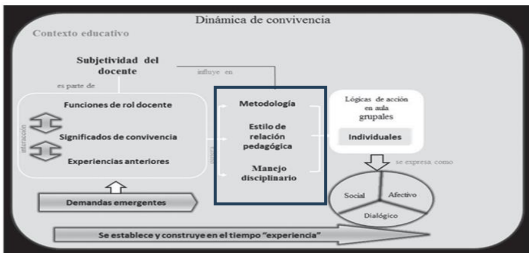
Figura N°1. Modelo: Construcción de Convivencia Escolar