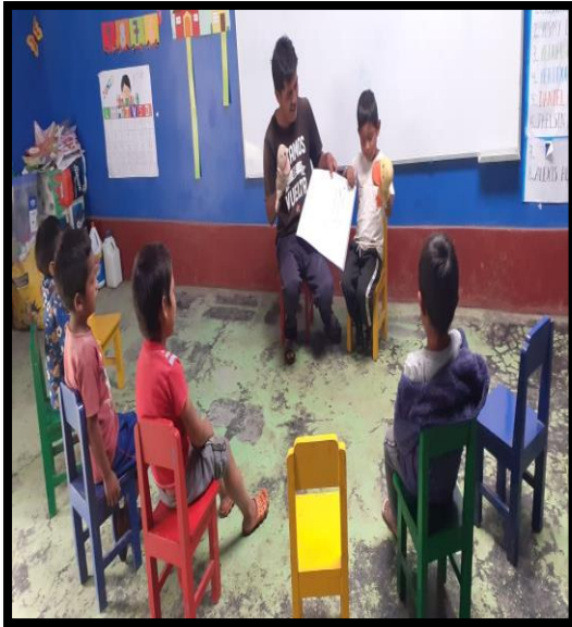
El padre de familia junto con su hijo narran el cuento "La flauta de oro" para los niños, usando los títeres y el cuaderno viajero.