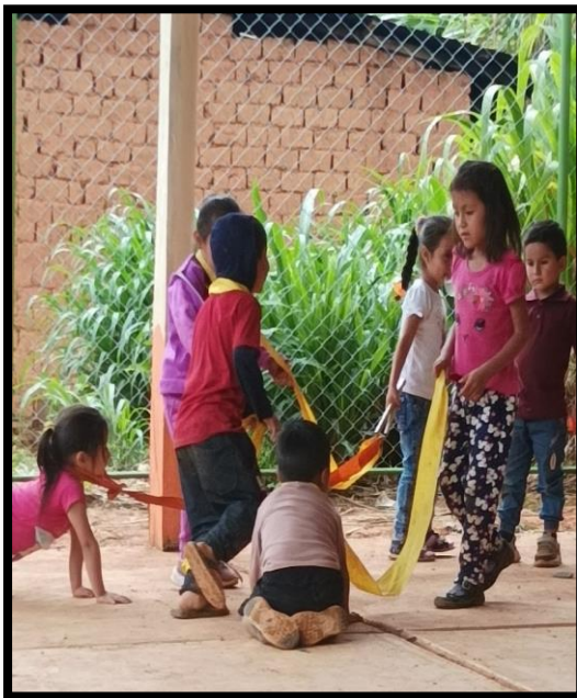
Los niños crean un juego de los perros, con las cintas y telas donde hacen gestos, sonidos del animal y el dueño del perro.