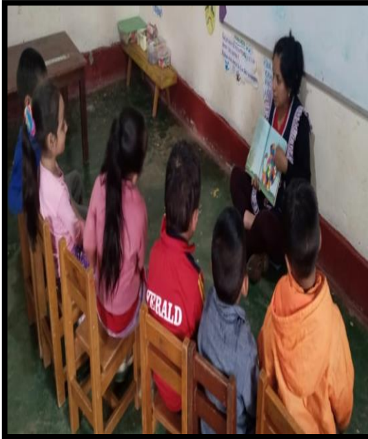
La docente narrando un cuento “Elmer el elefante” donde se observa los niños concentrados