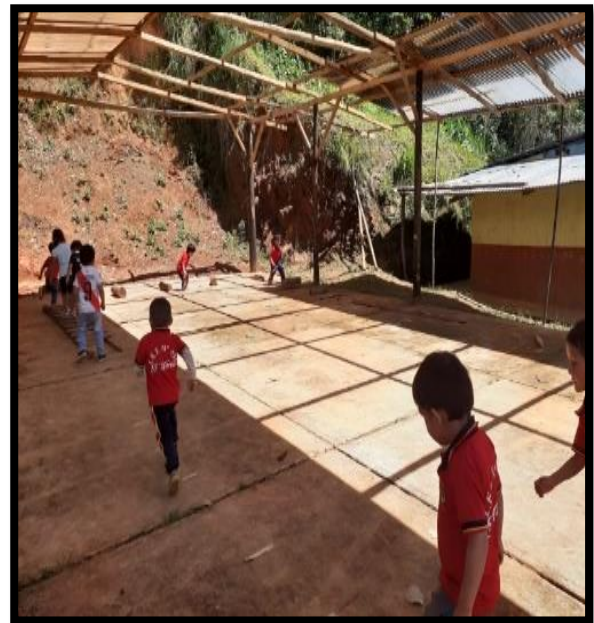
Se observa a los niños jugando al lobo en los bosques muy contentos.