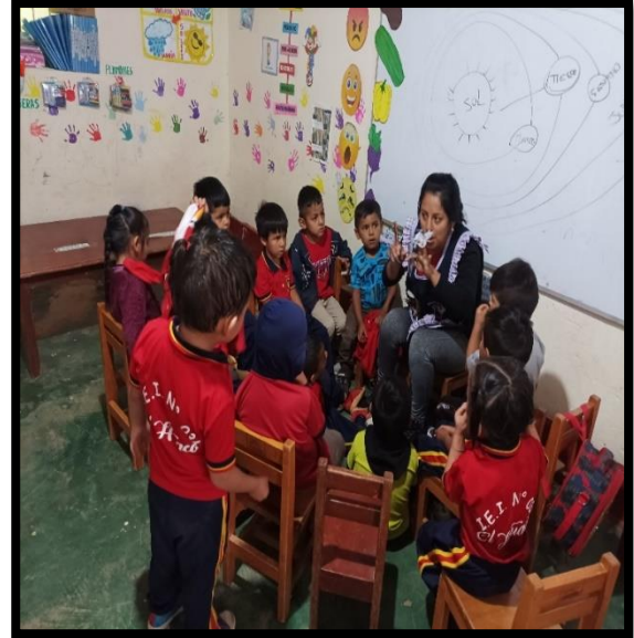
La docente narra un cuento con los títeres de dedo y se observa los niños muy concentrados.