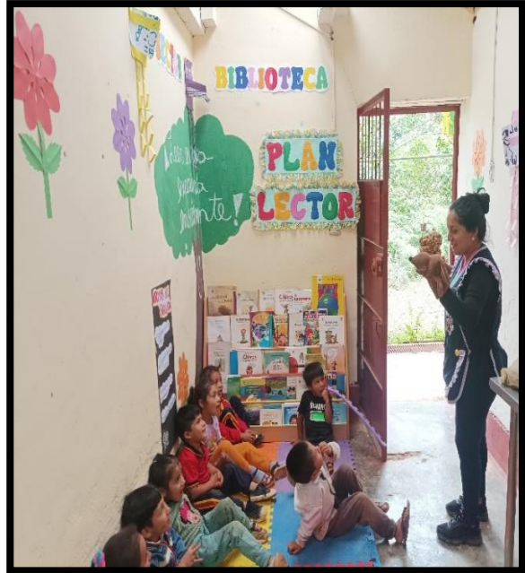
Se observa a la docente dramatizando un cuento de los animales en el bosque donde se observa a los niños muy atentos en el sector biblioteca.