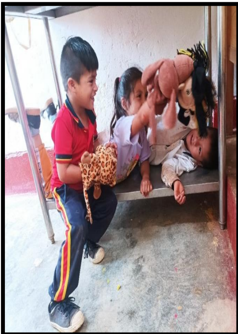
Se evidencia a los niños muy contentos dramatizando un cuento a su manera con los títeres.