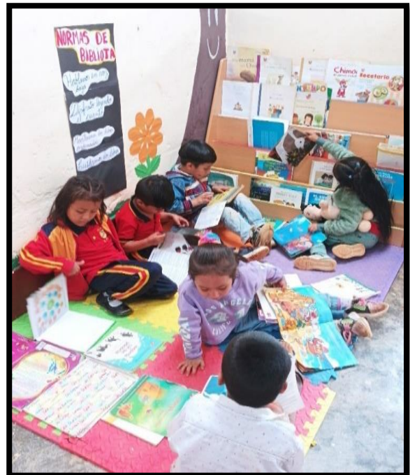
De manera libre los niños están leyendo cómodos en el sector biblioteca con los libros que más les gusta.