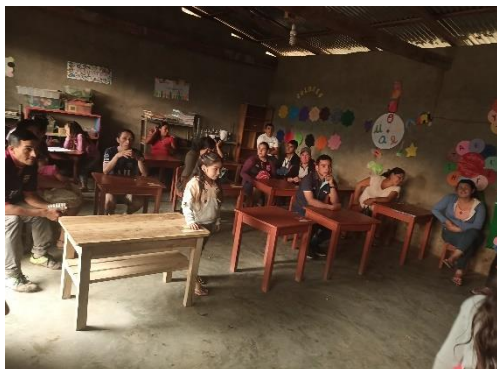
Padres de familia participan de un taller.