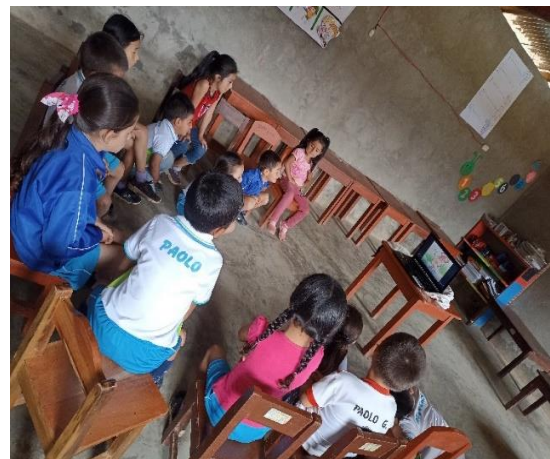
Niños observan videos sobre alimentación.