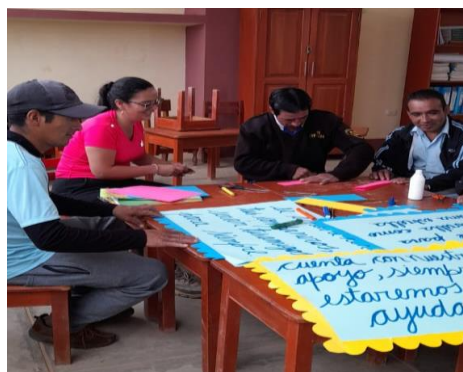
Trabajo con padres de familia.