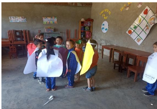
Niños y niñas dramatizando.