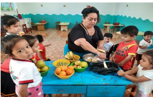
Niños participan de la preparación de recetas saludables (ensalada de frutas).