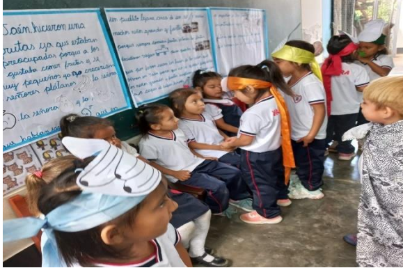
Niños dramatizando un cuento.