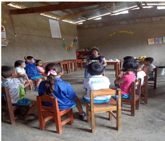
Niños y niñas reunidos en asamblea